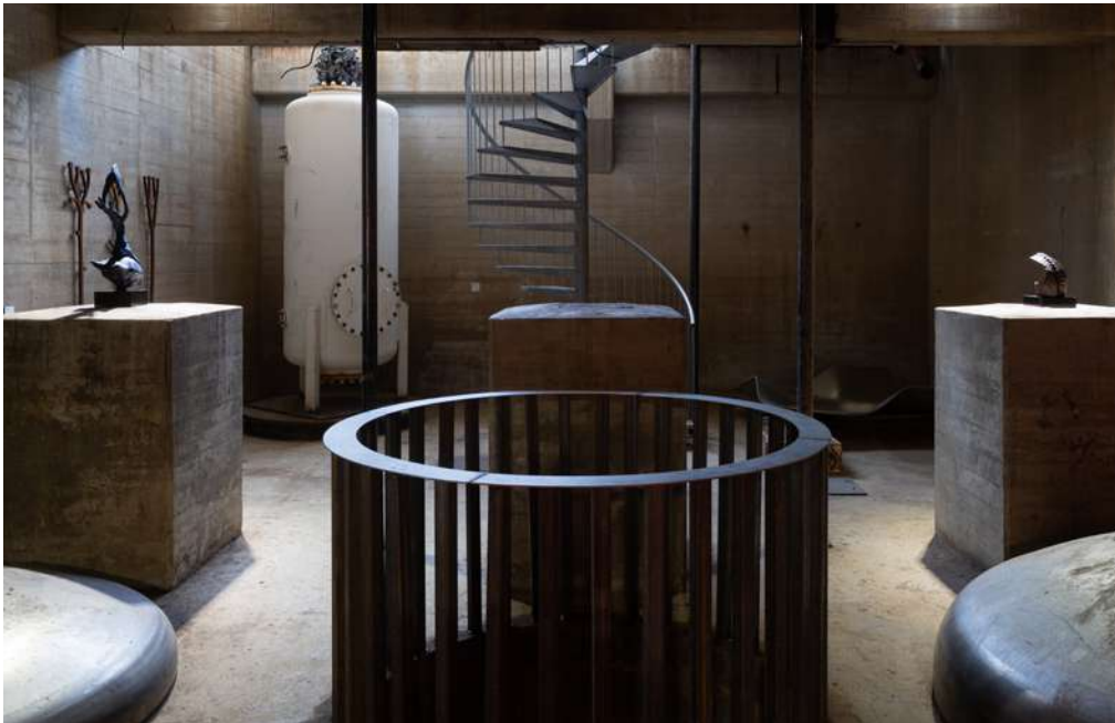
KOELWATERHAL EXPO SPACE BASEMENT