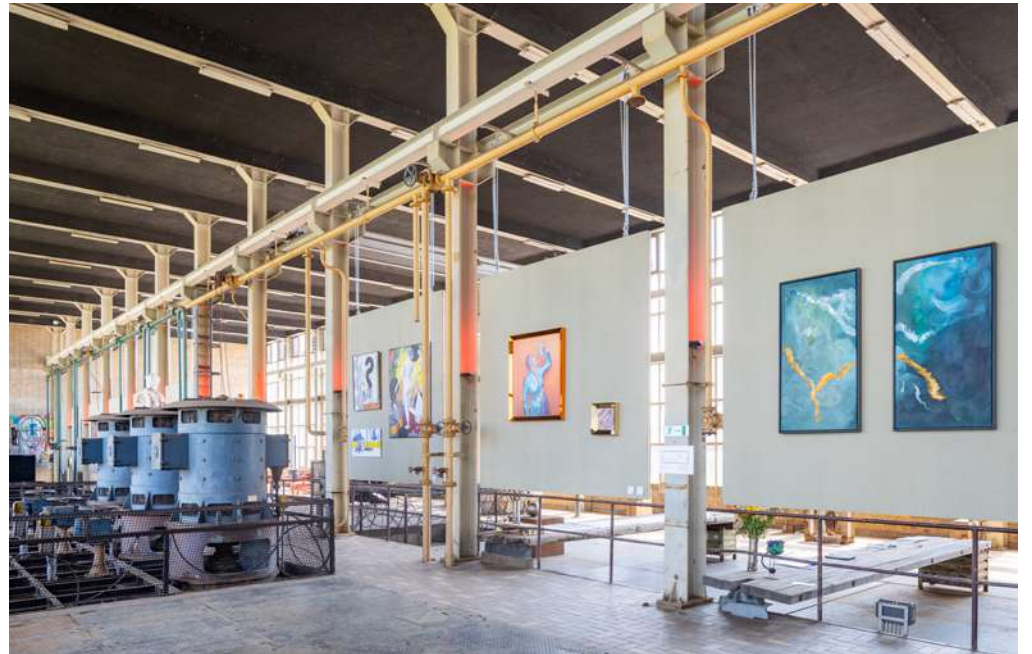
KOELWATERHAL EXPO SPACE GROUND FLOOR