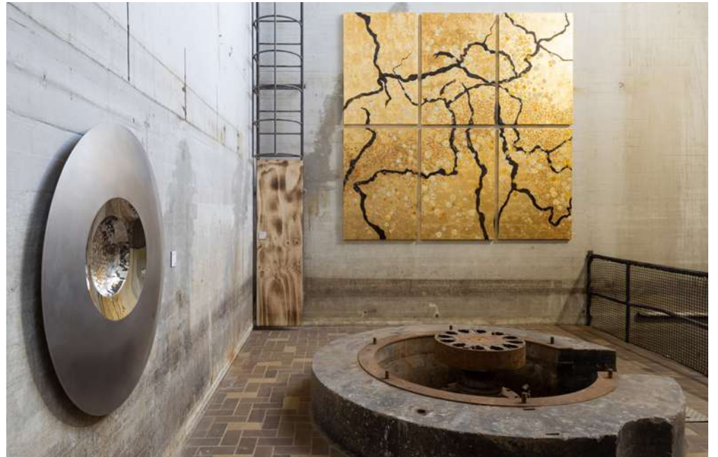
KOELWATERHAL EXPO SPACE GROUND FLOOR